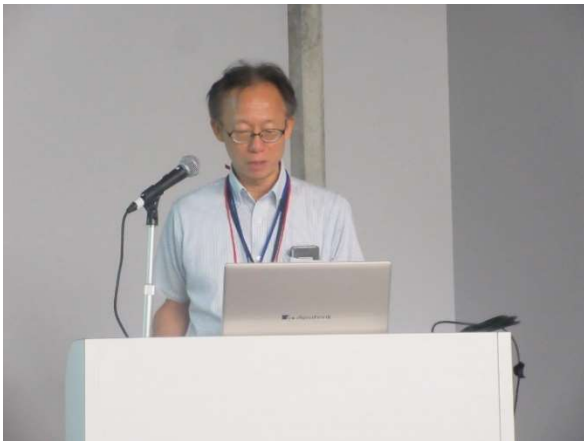
【講演：管診協技術委員会野村委員】