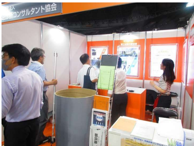
【管診協ブース来場者への対応①】