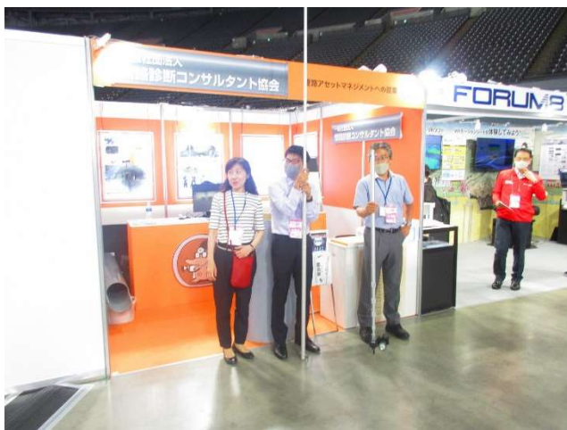
【管診協ブース状況】