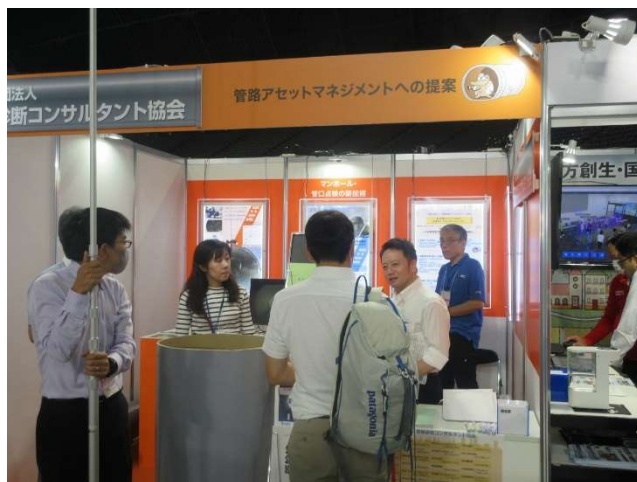
【管診協ブース来場者への対応②】