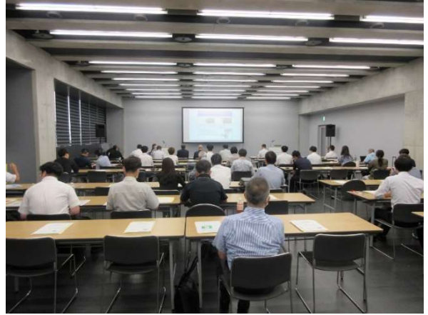
【セミナー会場の様子】