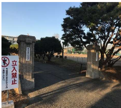
写真4 金足農業高校