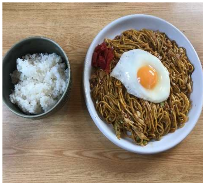
写真3 横手焼きそば

二日目の旅館は、山形県にある「湯野浜温泉福住」に宿泊しました。この旅館の素晴らしかった所は、各部屋での部屋食が楽しめるところです。大広間で食べる食事とは違い、部屋でリラックスして食事を楽しめるところは素晴らしかったです。