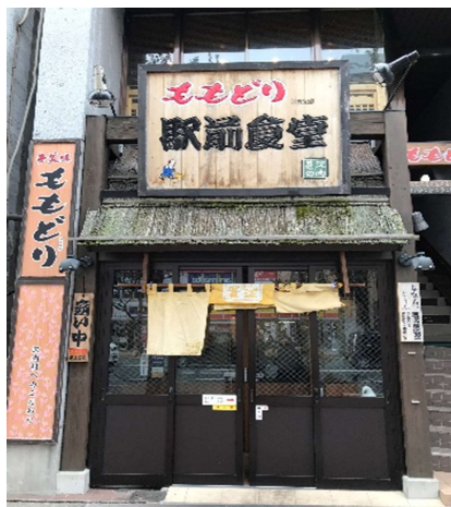
写真1 ももどり食堂

その後は、岩手県西南部にある「湯川温泉ふる里」に向かいました。行く道中は、紅葉が見ごろで大変美しかったです。ここの素晴らしいところは、各部屋に温泉がついており、今の季節ですと室内温泉から紅葉が見られることです。また、食事也大変豪華でとても美味しかったです。(写真2参照)