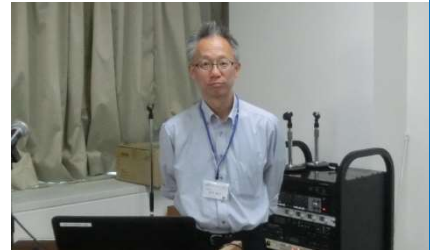
事例報告 (野村技術委員)