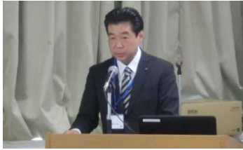
司会 (真田企画委員)