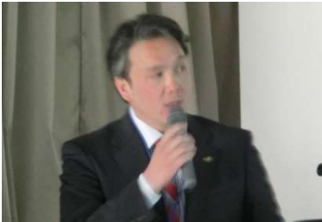
マニュアル説明 (飯干技術委員)