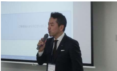
閉会挨拶 (市森理事)