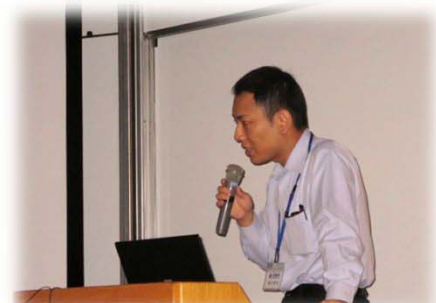
ブース紹介(管清工業)