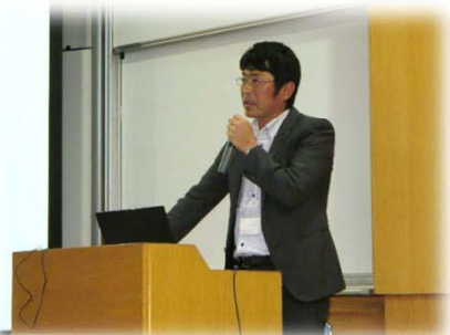
ブース紹介(ペンタフ)